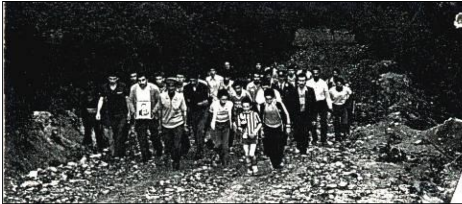
TEPEBAŞILI TARAFTARLAR ALDIKLARI 2. LİK KUPASINI ALŞAN DİKBAŞ'A GÖTÜRÜYÖRLER