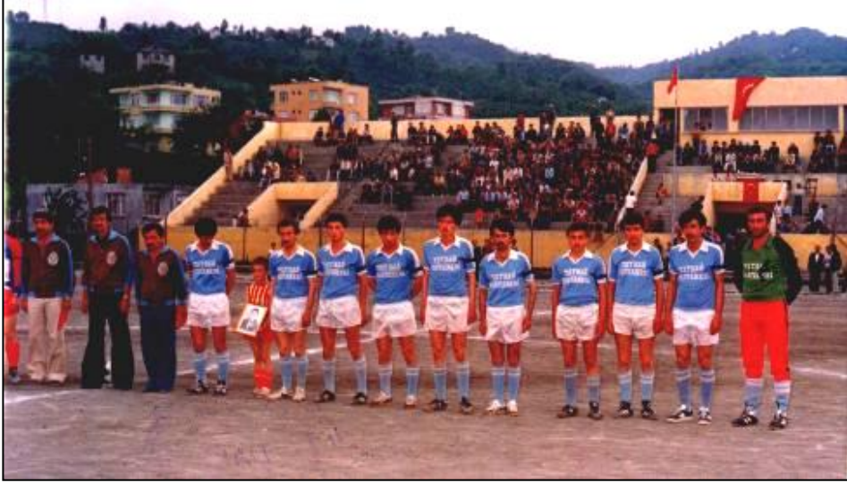
TEPEBAŞISPOR MATEM BANDIYLA SPORSEVERLERİ SELAMLIYOR