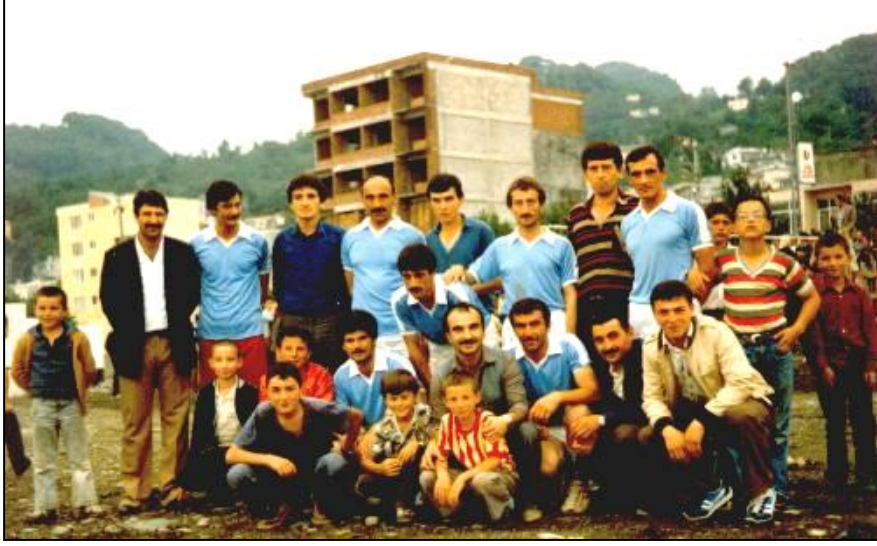
TEPEBAŞISPOR VOLEYBOL TAKIMI

Turnuvanın şampiyonu da Kulbalıkcılık oldu.